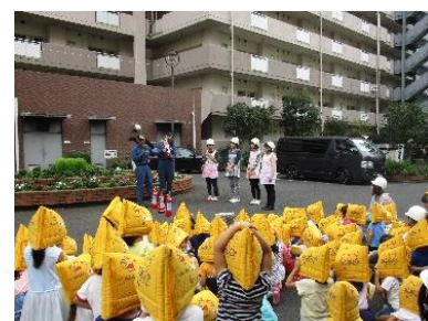
避難訓練の様子（毎月1回開

保護者またはあらかじめ保護者が委任した代理人に帰宅先を確認しながら引き渡しを行います。お迎えがいらっしゃるまで保育園にて保護しています。