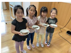
茹でたクルマエビは皆で美味しくいただきました！！