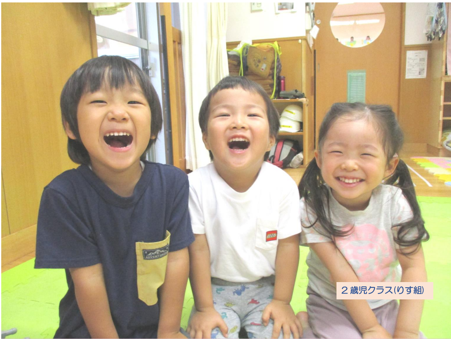
2歳児クラス(りす組)