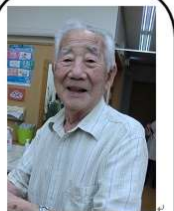
壺は私が作りました! ↓

梅雨時期となり、今年もデイハウスの紫陽花がきれいに咲きました。陶芸が趣味のご利用者様が紫陽花を飾る用にと、ご自宅より自作の壺を持って来て下さいました。白黒の為、分かりませんが濃い紫とピンク色のまだらの壺で紫陽花によく合います。お花を生けて下さったのは、生け花の先生をされていたご利用者様です。水揚げが上手く出来るようにと水切りや、茎を削り花が綺麗でいれるようにひと手間。それぞれ長い人生の中でのスキルが光っています!! ↓