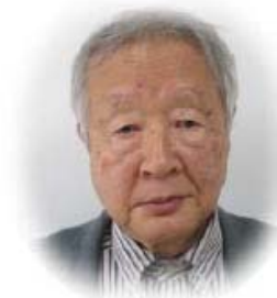
訪問リハビリ担当

（午後は予約制です。電話等でご確認の上お出かけください 在宅療養患者さんに対しては24時間対応いたします。）